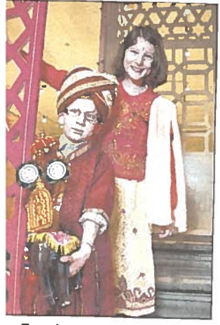
Für die ganze Familie

fest können von Bauernbrot und Käse über Kürbis- und Wildprodukte bis hin zu Wachauer Beef, Saft und Sirup im Großen Arkadenhof verköstigt werden. Beim Familienfest verwandelt sich der Burggarten in einen Abenteuerpark mit Workshops, Bastel- und Spielstationen. Infos: www.schallaburg.at