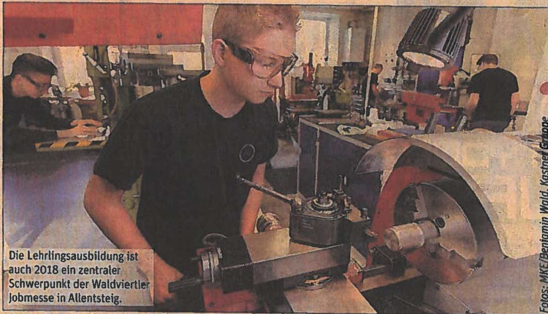
Die Lehrlingsausbildung ist auch 2018 ein zentraler Schwerpunkt der Waldviertler Jobmesse in Allentsteig.