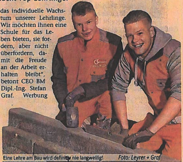
Eine Lehre am Bau wird definitiv nie langweilig!

das individuelle Wachstum unserer Lehrlinge. Wir möchten ihnen eine Schule für das Leben bieten, sie fordern, aber nicht überfordern, damit die Freude an der Arbeit erhalten bleibt“, betont CEO BM Dipl.-Ing. Stefan Graf. Werbung