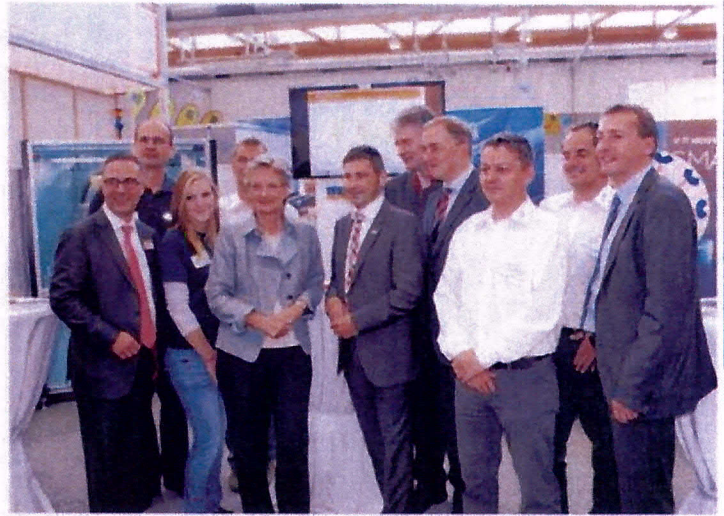
Hochkarätige Besucher wie etwa Bundesministerin Claudia Schmied (4.v.l.) besuchten die 2. Jobmesse in der Horner Sporthalle.