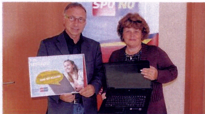
Soll zur Chancengleichheit und Vertiefung von technischem Verständnis dienen.

Das Land Niederösterreich müsse in die Bildungsinfrastruktur investieren, so Wiesinger: „Die Laptop-Modelle müssen auf das Alter der Kinder angepasst sein, beispielsweise mit speziellen Kinderlaptops für unsere Kleinsten.“ Der SP-Politiker merkt weiters an: „Es geht hier auch um Chancengleichheit, denn Kinder aus