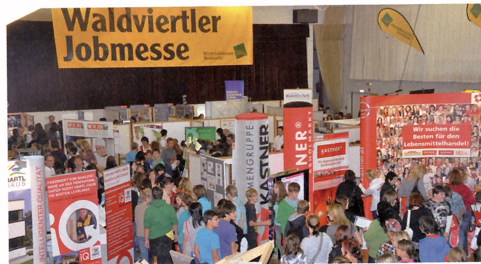
Am 30. September und 1. Oktober 2011 fand die 1. Waldviertler Jobmesse in der Stadthalle Schrems statt.

Am „Jimmy on tour“-Stand der Wirtschaftskammer NÖ stand den jugendlichen Besucherinnen Lehrstellenberater zur Verfügung, am Stand des WIFI NÖ konnten sich die BesucherInnen über Aus- und Weiterbildungsmöglichkeiten informieren. Am Stand des AMS Niederösterreich konnten die BesucherInnen kostenlose Interessenstests durchführen