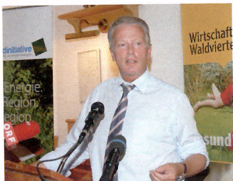
Bundesminister Dr. Reinhold Mitterlehner beim 1. Wirtschaftsgespräch des Wirtschaftsforum