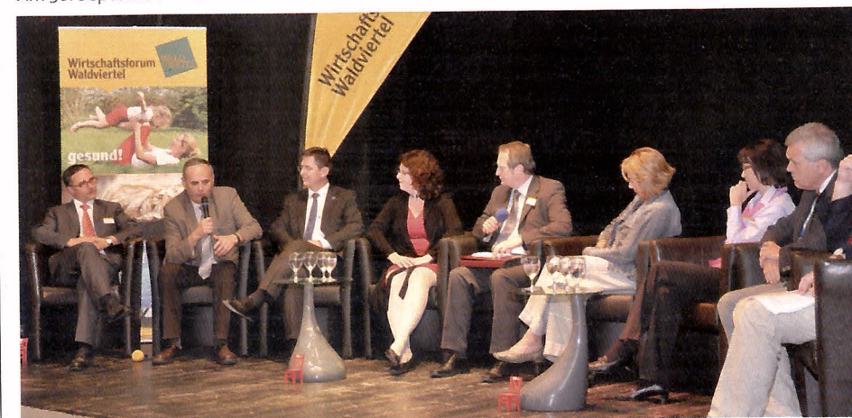
1. Waldviertler Bildungsgipfel im Rahmen der 1. Waldviertler Jobmesse