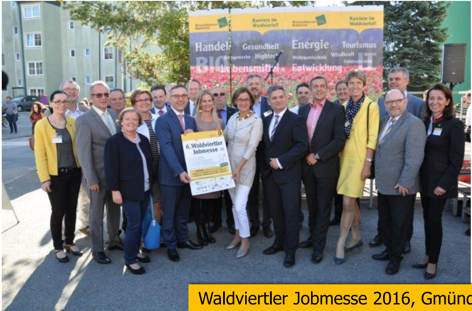
Waldviertler Jobmesse 2016, Gmünd