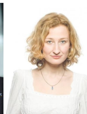
Manuela Seidl , Schauspielerin, Intendantin des Theater Forum Schwechat