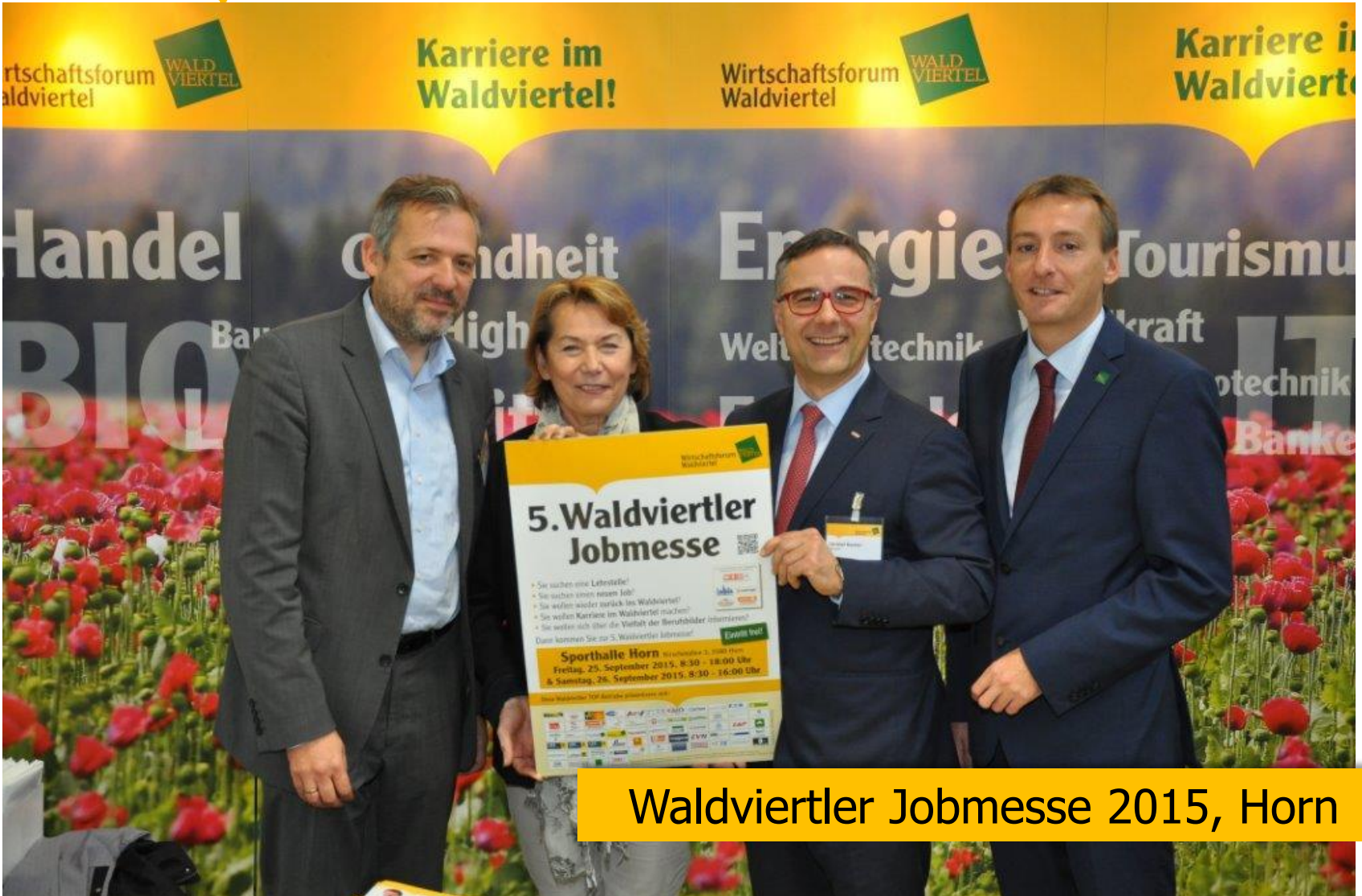
Waldviertler Jobmesse 2015, Horn