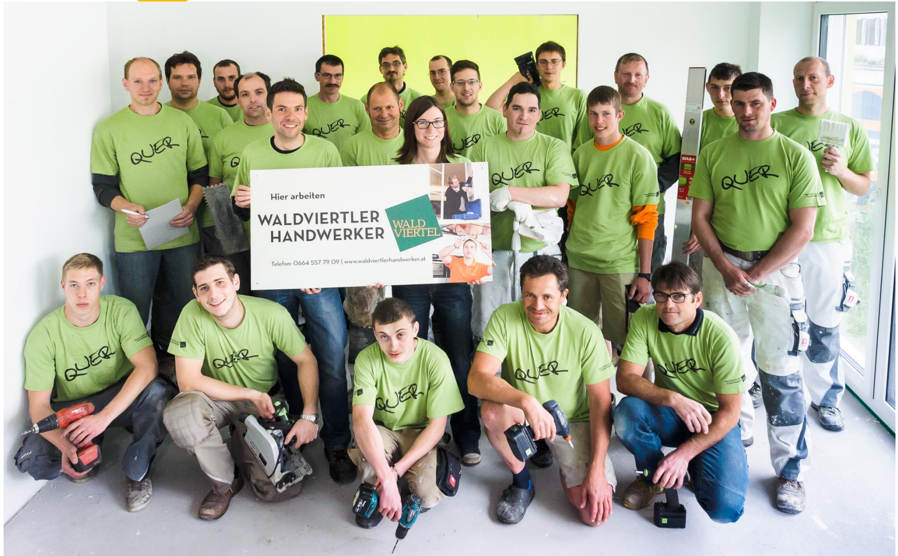
Wirtschaftsforum Waldviertel - Generalversammlung, 18.11.2016